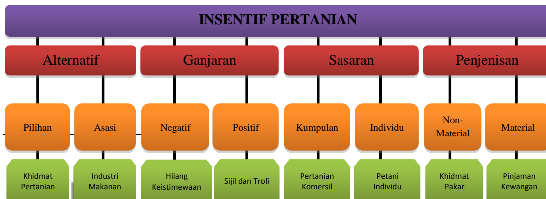
Rajah 1: Contoh Insentif Pertanian Bersepadu

Berdasarkan fakta ini, ia jelas menunjukkan kerajaan berperanan sebagai tulang belakang yang dapat mengubah perilaku para petani supaya gigih bekerja mengusahakan tanah pertanian. Untuk itu, penawaran insentif pertanian mestilah kukuh dan menarik supaya dapat mengubah gaya penghasilan para petani agar menjadi lebih kompetitif dan mempunyai nilai-nilai komersil yang tinggi. Dalam erti kata lain, penawaran insentif pertanian mestilah dipelbagaikan. Kepelbagaian tersebut dapat digambarkan secara ringkas menerusi gambar rajah berikut: